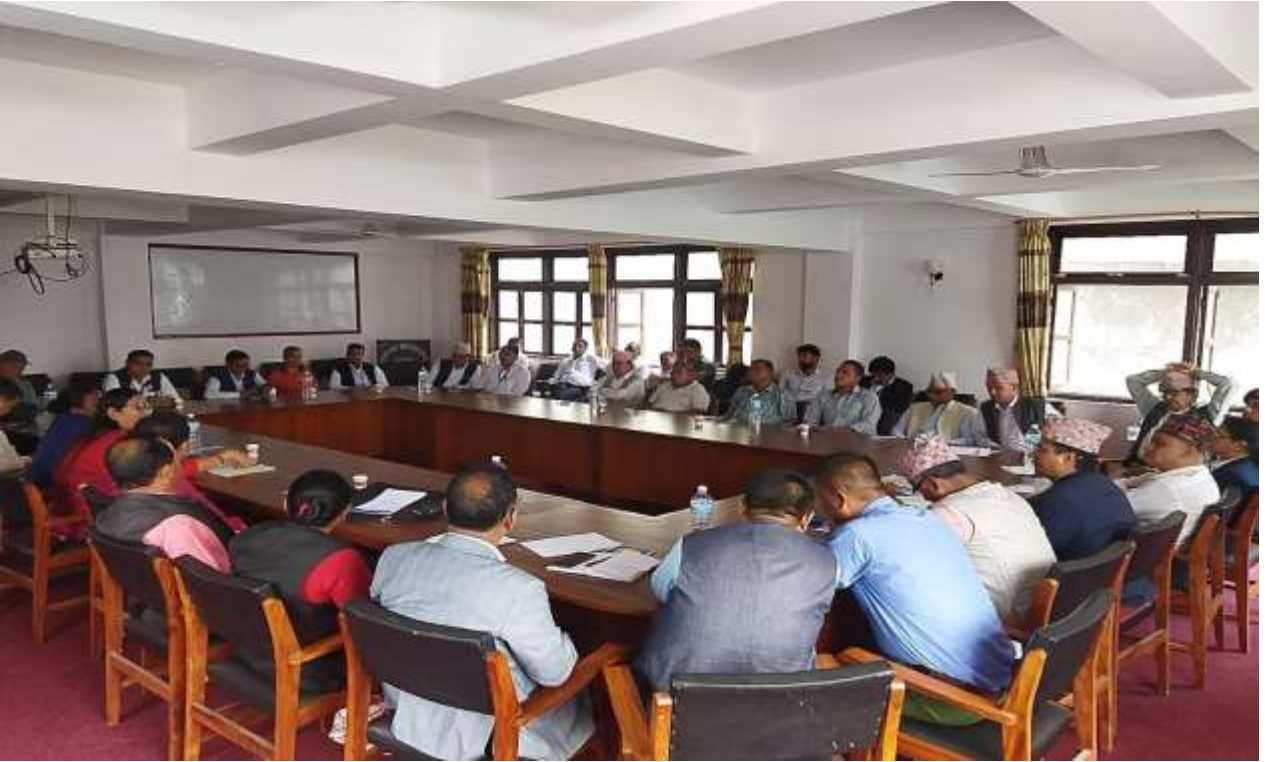
मिति २०८०।४।३१ गते जिल्ला विपद् पूर्व तयारी तथा प्रतिकार्य योजना २०७९ अध्यावधिक गर्न बसेको बैठकको फोटोहरु